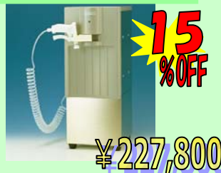
純水製造装置 ピュアポートPP-201