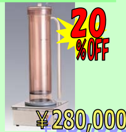
超音波ピペット洗浄機