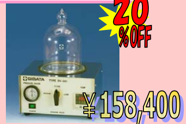
ベルジャー型 パキュウムオープン