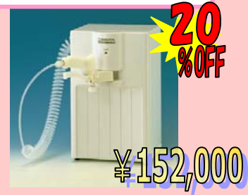
小型純水製造装置 ピュアポート PP-101