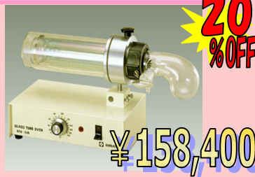
ガラスチューブオープン GTO-200