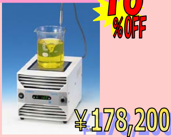
クールマグネスター MGC-100