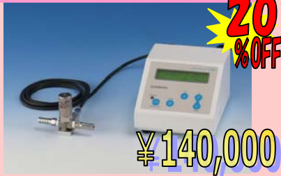
パキュウムコントローラー V-302